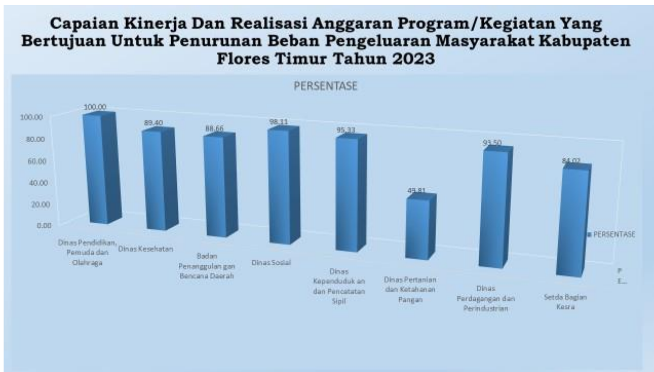
Grafik 2.1 Persentase Realisasi Anggaran Program/Kegiatan Perangkat Daerah untuk Menurunkan Beban Pengeluaran Masyarakat Penanggulangan Kemiskinan Daerah Kabupaten Flores Timur Tahun 2023