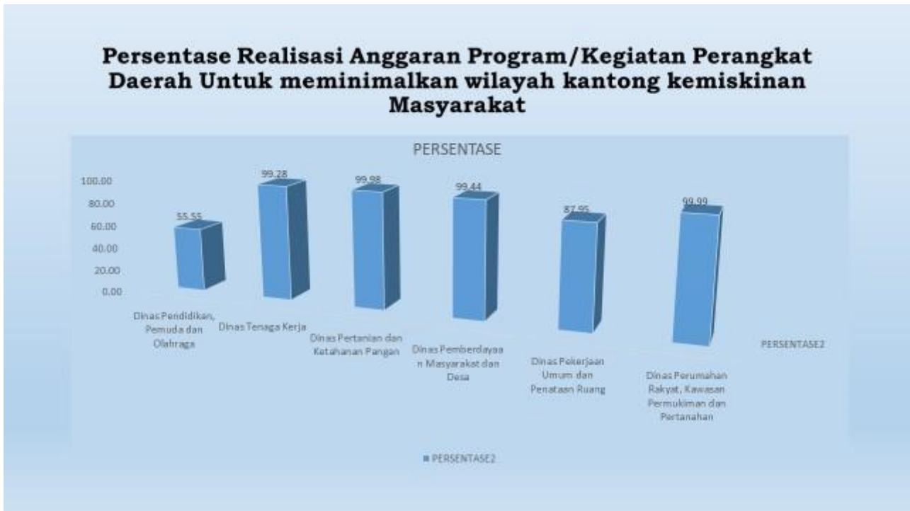
Grafik 2.3 Persentase Realisasi Anggaran Program/Kegiatan Perangkat Daerah Untuk meminimalkan wilayah kantong kemiskinan Masyarakat Tahun 2023